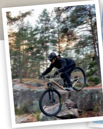
Joannalle harrastuksista tärkein Etelä-Suomessa on maastopyöräily, myös talvella.