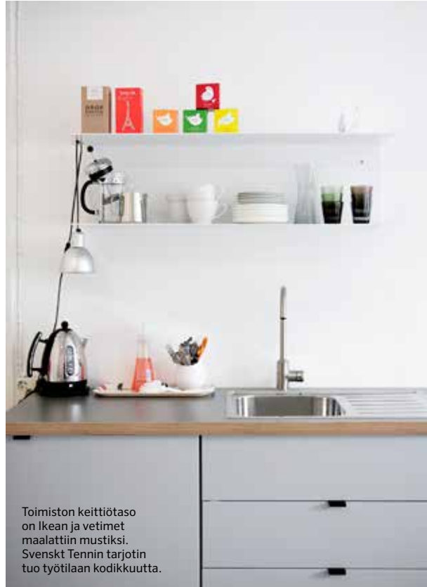
Toimiston keittiötaso on Ikean ja vetimet maalattiin mustiksi. Svenskt Tennin tarjotin tuo työtilaan kodikkuutta.