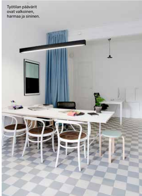
Työtilan päävärit ovat valkoinen, harmaa ja sininen.