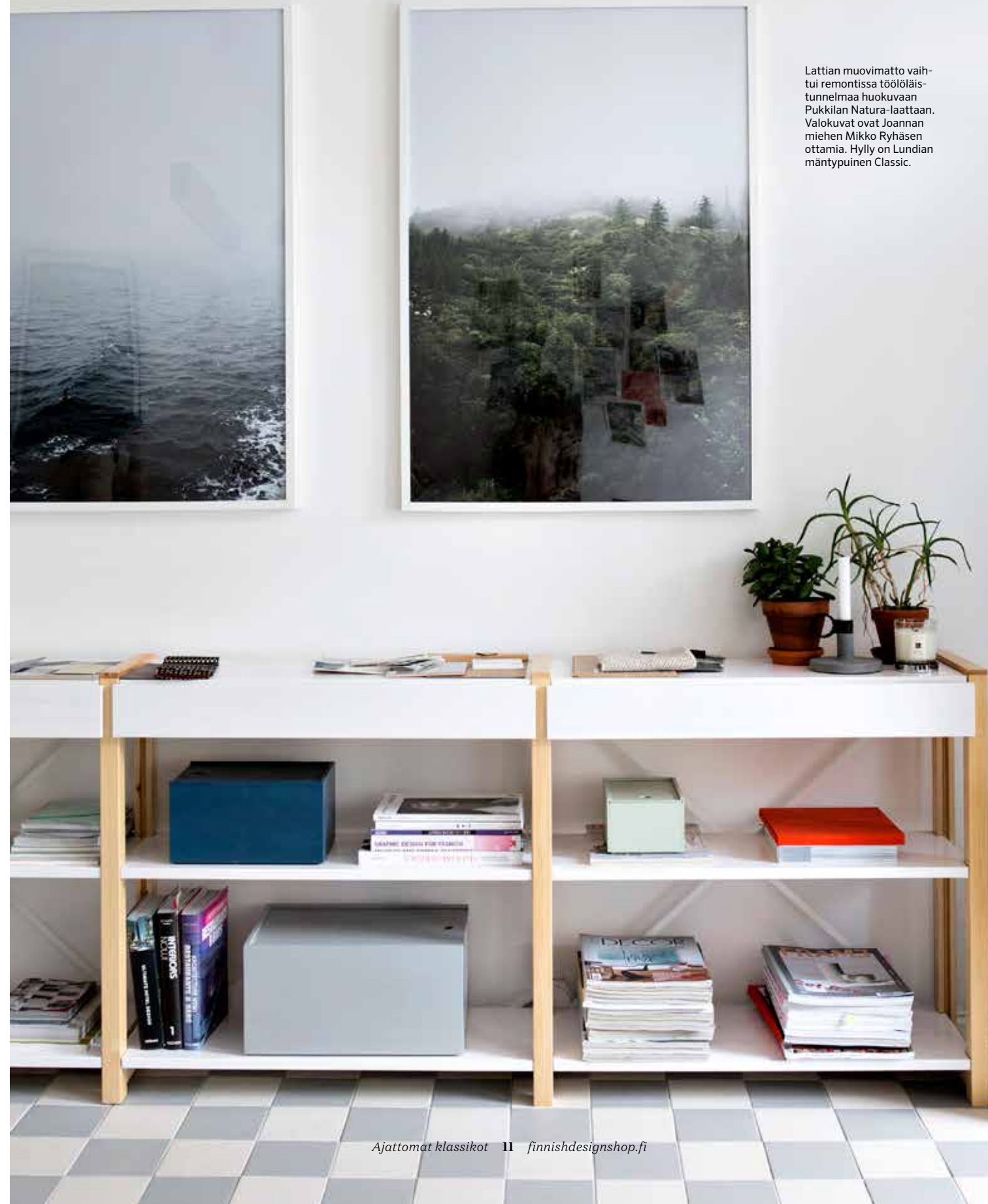
Lattian muovimatto vaihtui remontissa töölöläis-tunnelmaa huokuvaan Pukkilan Natura-laattaan. Hylly on Lundian mäntypuinen Classic.